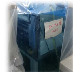
热压机(装配、热硬化)