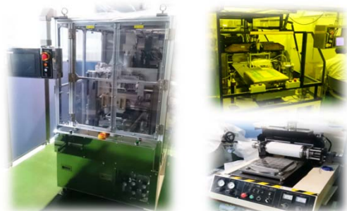
摩擦机设备(小~中型)