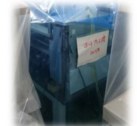
ホットプレス機 (組立、熱硬化)