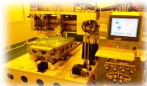
シール、トランスファ塗布装置