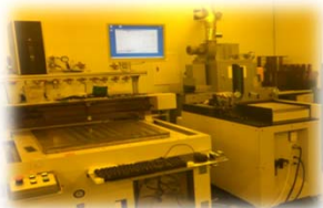
カット装置、偏光板貼合装置