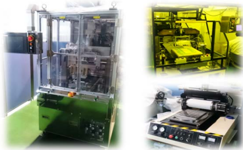
ラビング装置 (小~中型)